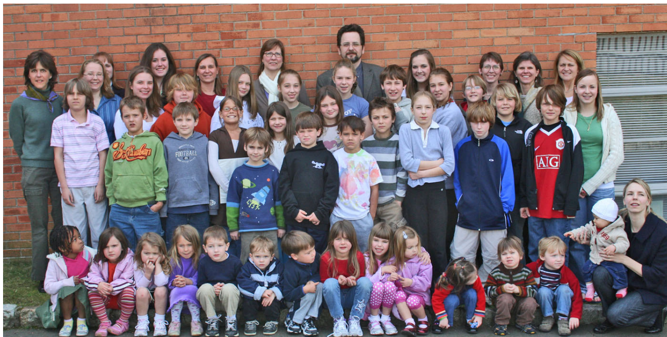
Nudžersijas skolas saime