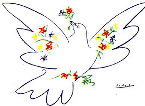
Pikaso "Miera balodis"

Arī Jēzus bija starp tiem, kas nāca pie Jēzus, lai kristītos. Un tūdaļ pēc savas kristīšanas Jēzus no "ūdens izkāpdams redzēja debesis atveramies un Garu kā balodi uz sevis nolaižamies". Mums ir viegli šo ainu iedomāties: Jēzus stāv seklā Jardānas upē, un nez' no