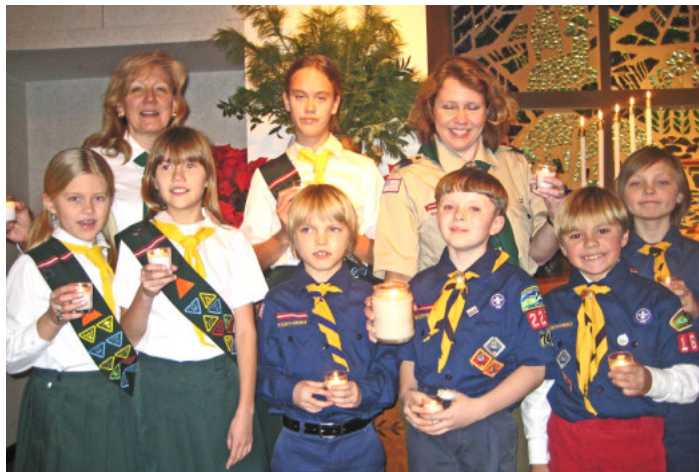
Miera gaismas dalītāji Salas baznīcā.

debesīs – Betlēmes zvaigznei. Jeruzālemē gudrie satikās ar ķēniņu Herodu. Un Herods gudriem teica, ka vēlas “aiziet bērniņu pielūgt”, taču tie nebija Heroda patiesie nolūki - īstenībā viņš gribēja Jēzus bērnu nogalināt. Kad eņģelis trīs gudros sapnī brīdināja, viņi pie Heroda neatgriezās. “Tad Herods ļoti apskaitās un lika apkaut visus bērnus Betlēmē un visā viņas apkārtnē divi gadi vecus un jaunākus.”