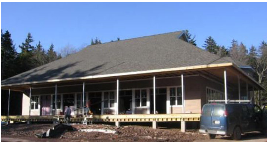
Topošā ēdamzāle pavasara atkušņa laikā