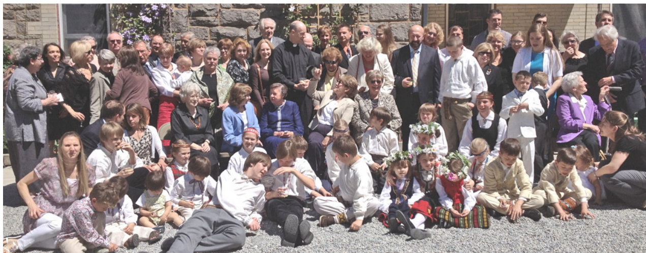
Bronksas pamatskolas 60 gadu jubilejas saime