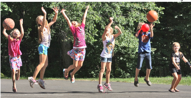
Meitenes uz basketbola laukuma