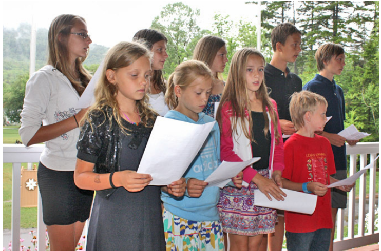
Koris dievkalpojumā uz Zariņa zāles verandas

Meitenes 9. mītnē izdomāja kā senlatvietis reaģētu būdams nometnieks 21. gadsimtenī Katskiļos: 1) Ja es