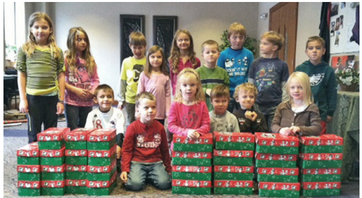
Bērni kopā ar sapakotām dāvanu kastēm