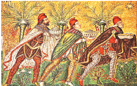
Trīs gudrie ved dāvanas Kristum

Pateicos no sirds, kur amata māšas un brāļi, bet dažreiz arī kāds no draudzes locekļiem bez īpaša amata man ir palīdzējis tā meklēt, lai es atrastu. Paldies par Dieva klātbūtnes zīmēm caur Jums – ar padomu un palīdzību, ar Jūsu viesmīlību. “Mums šeit nav paliekamas pilsētas, bet mēs meklējam nākamo” izjūtu arī manā kalpošanā, apzinoties, ka šie vārdi raksturo daudzu mūsu dzīves gaitu. Uz mūžīgām Tēva mājām nācies izvadīt šajā gadā mūsu pirmo sievieti mācītāju Austrālijā, agrāko LELBA pārvaldes priekšnieku un LU Teoloģijas fakultātes dekānu, abus vecākos LELBĀL mācītājus. Bonnā, Vācijā, ordinējām amata māsu no Latvijas kalpošanai Denverā, Amerikā. Rīgā sveicām Otavai un Montreālai izraudzīto mācītāju.