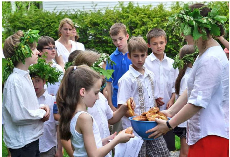
J u b rniem pasniedz dens kli erus