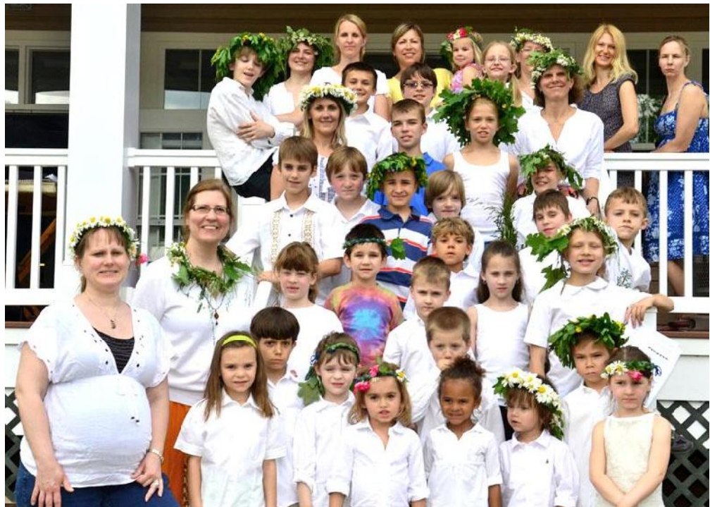
udžersijas skolas saime uz damz les tr p m J u vainagos