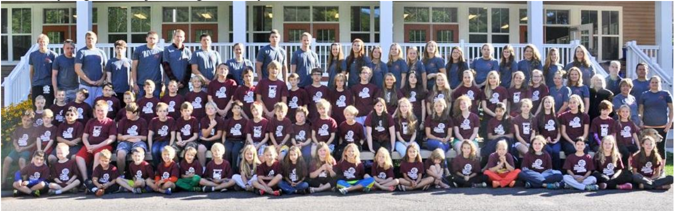
Valodas perioda saime