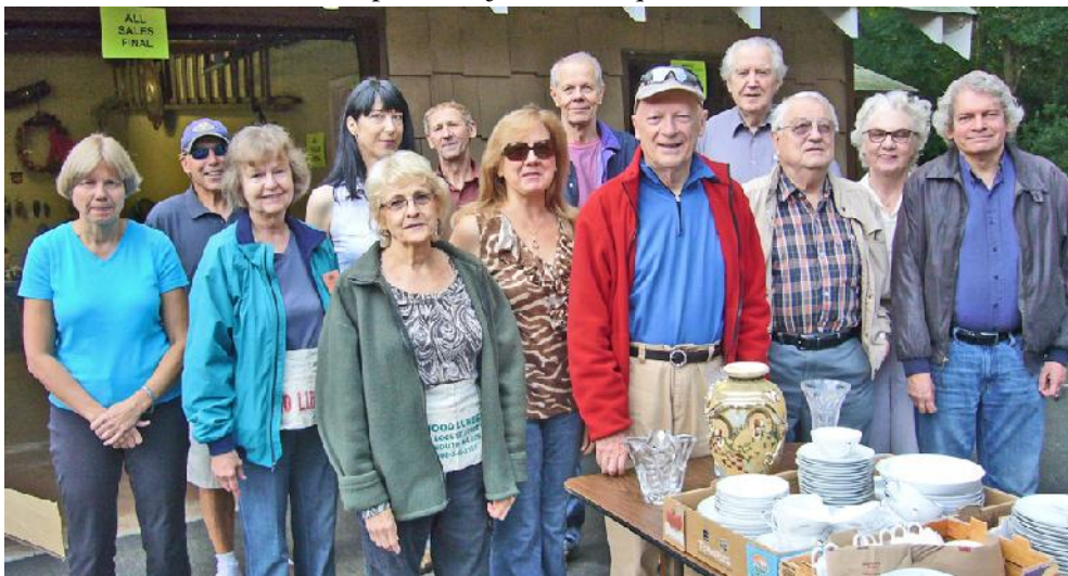
Fotogr fij s: darbnieku pulks, kas pal dz ja tirdzi