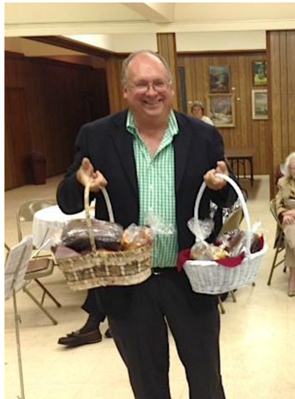
riks Niedrītis ar laimētiem

Šo dziesmu bieži dziedāja 2X2 nometnēs. Lielais vairums kļūti esošiem likās, ka no kalnu skatoties, dziedātājs skatās vai ir krievi vai vācu okupanti, vai vispār zeme pamesta, bet atrod kā tomēr vāc latviešu rokas. Istenībā "ar" nozīmē šajā gadījumā ir "ar" ar mēksto "r". Dziedātājs skatās vai saimnieko krievi vai vacieši, bet vāc saimnieko latvieši.