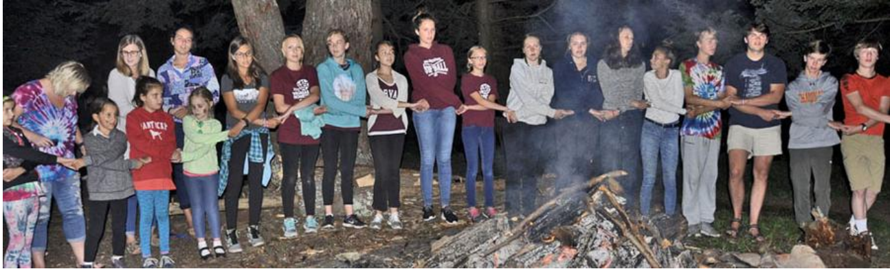
Katskilu nometnieki sa musies rok s pie ugunskura