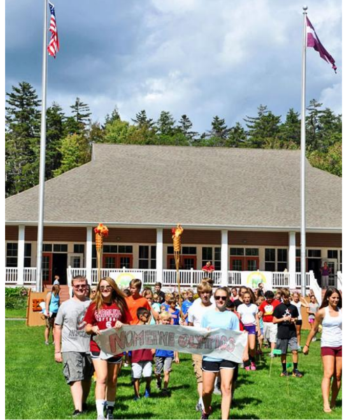
Nometnes olimpi de

Camp ended with our closing concert on August 13 th , which is always well attended and this year a