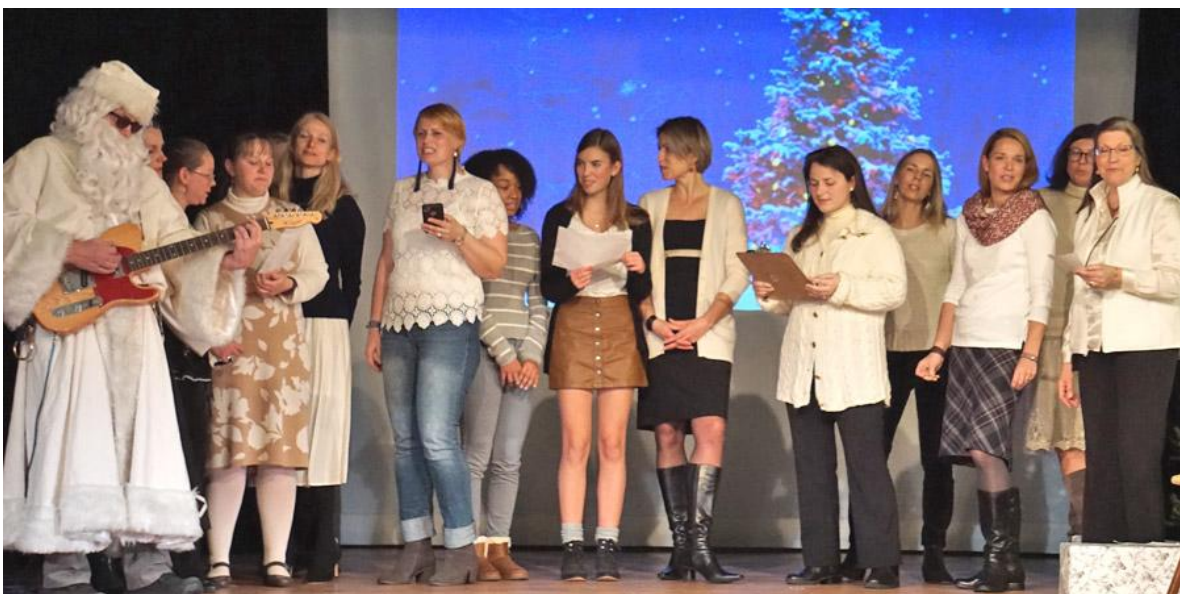
Ziemassv tku vec tis pievienoj s skolot j m ar it ras sp li pavadot rokgrupas "L vi" dziesmu "Egl te".