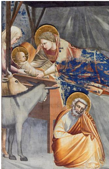
Kristus silēt - Džioto, 14. g.s.

Ziemsvētkos svinam satikšanos ar imēnes saimi, ar draugiem un ar draudzi. Bet reizē atceramies, kas bija, un ar dēdzēbu skatē mies uz to, kas būs. Jēzēps un