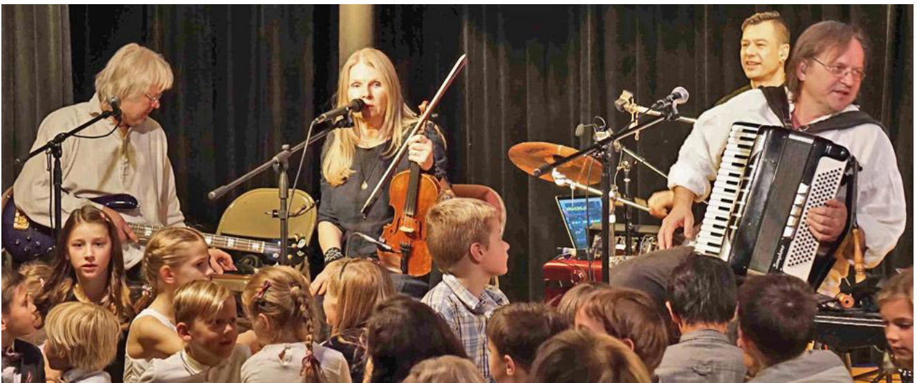
Jonkeru bāznīcā lejās zūlūi spēlū, skolas bārnū ar Iiem kopū dziedā