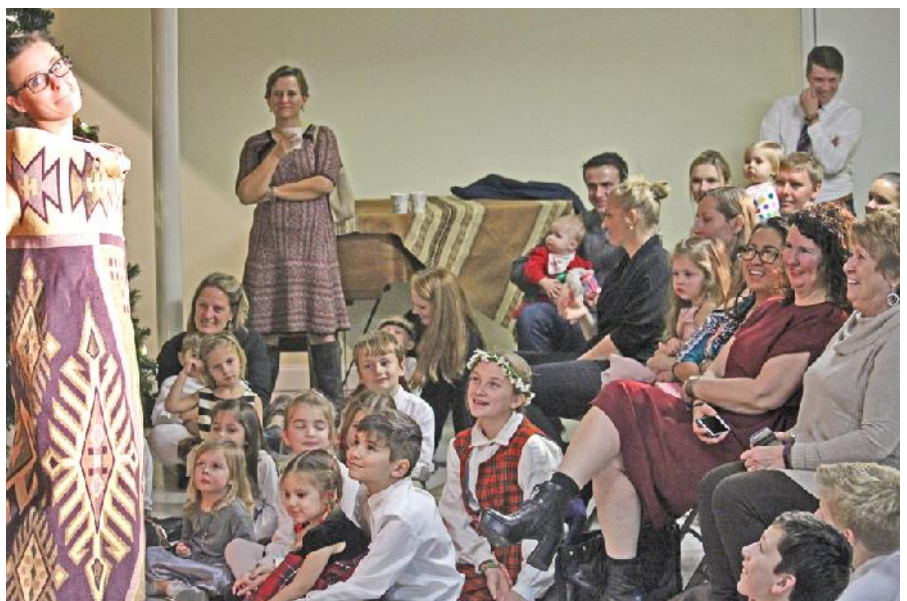
Publika bauda te tra izr di