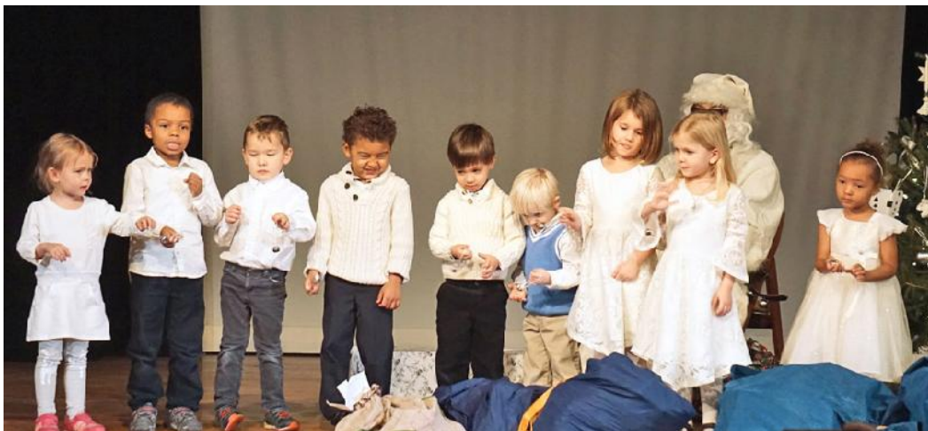
Pirmsskolas klase uzstājas ar savu priekšnesumu.