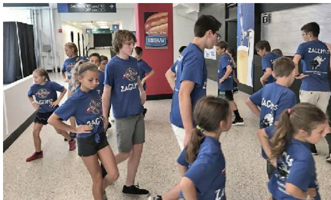
M in jums Baltimor

patiesi priec ja kl tesošos. Gatavošan s un piedal šan s J u svin b s Priedain bija v l viens solis tuv k deju lieluzvedumam. T bija pirm reize, kad skol ni dejoja uz liel s skatuves kop ar citu kopu dejojot, jo J os ar piedal j s u jorkas "Jumis", Filadelfijas "Dzirkstele" un Vašingtonas "Namejs". T bija patiesi vrt ga un noder ga pieredze ce uz Dziesmu sv tkiem.