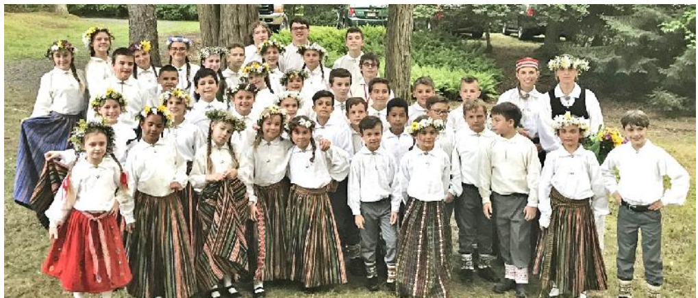
Lielais Zagl tis m in jum Priedain

Pirmais p rbaud jums Dziesmu sv tkiem bija uzst šanas skolas 65. jubilejas svin b s Priedain . Daudziem t bija pirm reize deju uz skatuves, kas tom r ir savad k k uzst ties skolas sar kojumos turpat udžersijas skolas telp s. T ar bija pirm uzst šan s liel kas publikas priekš . “Zagl ša” deju j godam iztur ja šo p rbaud jumu un vi u raitais dejas solis