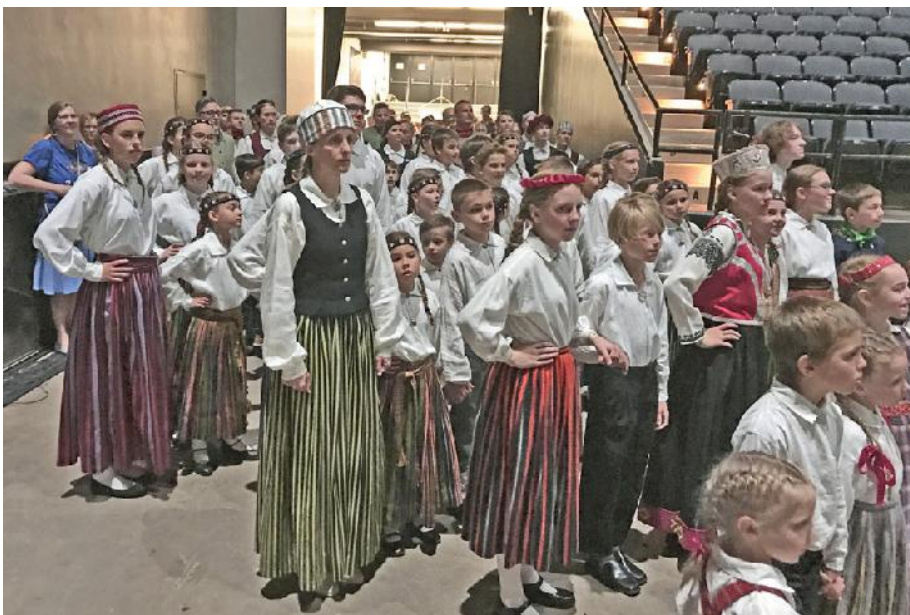
Zagl tis - uzn ciens - deju kopu iepazī stin šana Baltimor

Gatavošan s kopkora koncertam pras ja tikpat lielu pašdiscipl nu un darbu ar nopietnu dzied šanu skol un vair kiem m in jumiem Baltimor . Koncerta dienas r t b rnu koris pievienoj s kopkora m in jumam. udžersijas skolas 14 dzied t ji bija b rnu kora liel k grupa, kam piebiedroj s dzied t ji no Jonkeru un Bostonas pamatskol m. B rni dzied ja asto as dziesmas kop ar sv tku kopkora 400 dal bniekiem un to dar ja no balkoniem, kas bija skatuves ab s pus s. Tas va vi iem klusi s d t p r jo dziesmu laik , vienlaic gi esot da ai no kopkora ar skatu uz diri entu un skat t jiem. B rnu korim bija solo panti dziesm s "Dod, dievi i" un "Ziedi, ziedi rudzu v rpa", kuriem pievienoj s ar Garezera vidusskolas koris, t