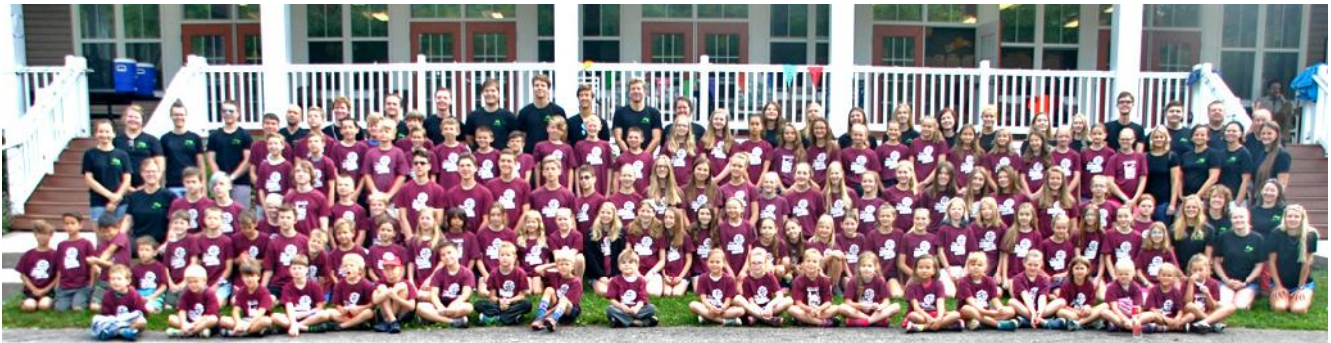
1. perioda kopbilde