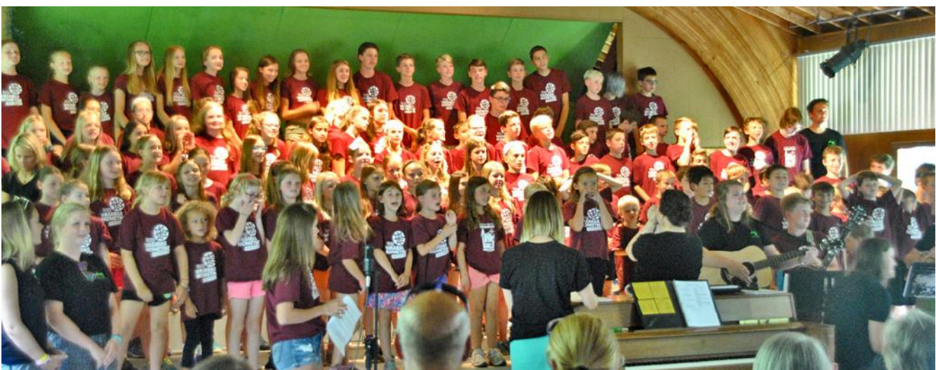
1. perioda koncerts Kris tes Sk res vad b