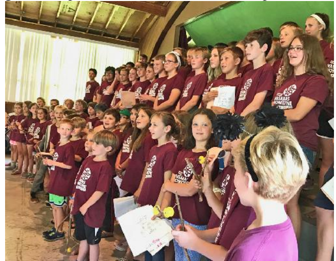
Heritage Nomtenes koris