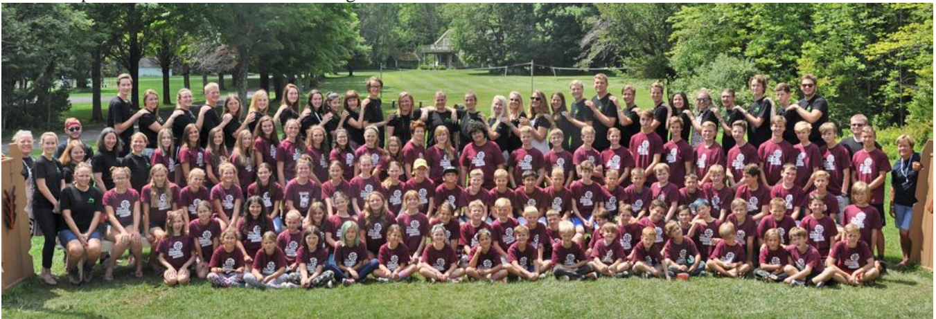
Heritage nometnes kopbile