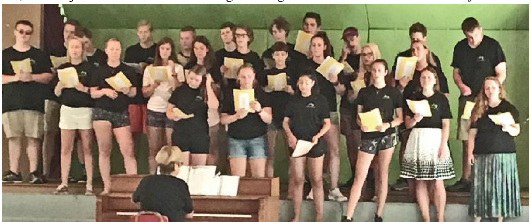
Heritage perioda vad t ju koris ar Ir nu Jasutu pie klavier m