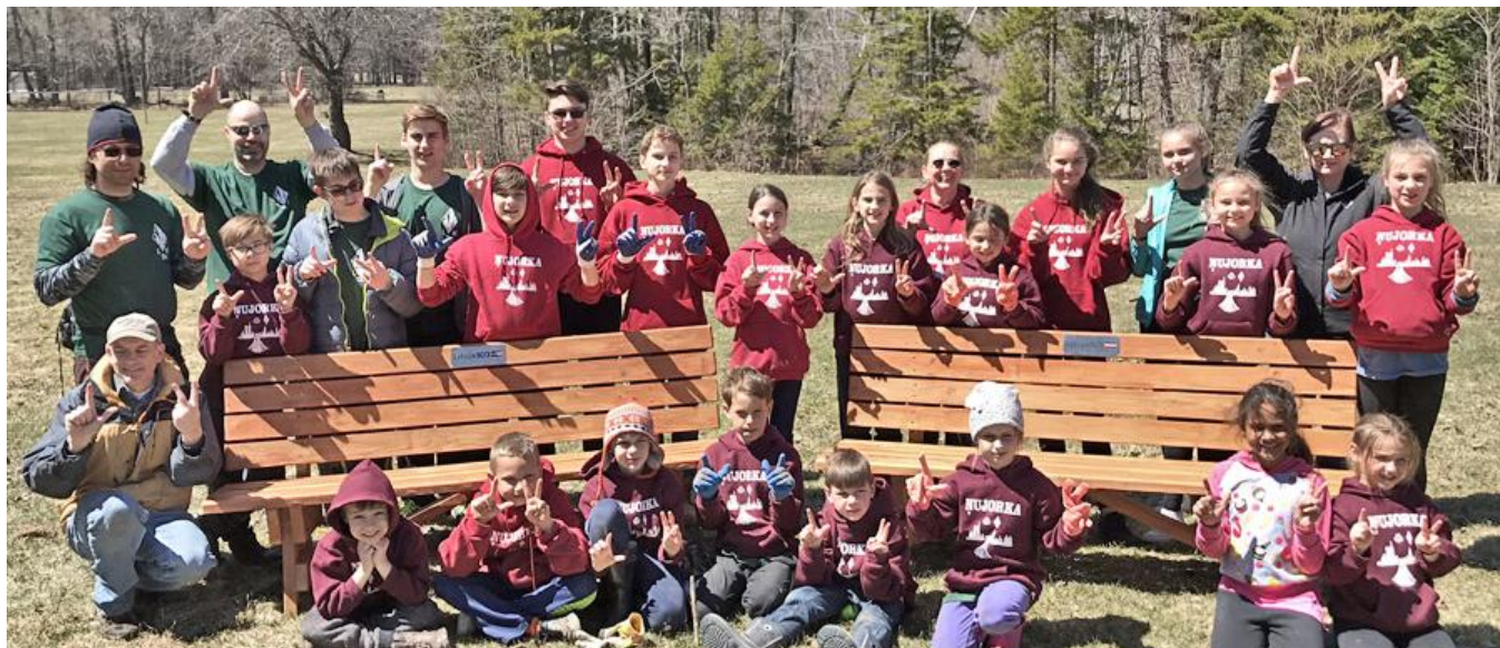
R gas 90. skautu vien bas un Zil kalna 4. gaidu vien bas dal bnieki no udžersijas latviešu skolas saimes

sakrto š nti un izz t kokus, kas viss ar stenoj s. gadus. Varb t t var k t par ikgad ju trad ciju ar Viss liecina par talkas idejas noder gumu ar šeit, ujork ! t lu no Latvijas. Liel talka Latvij jau notikusi 10 Krist na Putene