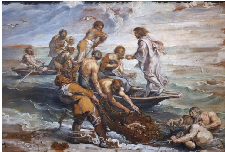
Jēzus aicina pirmos mācekļus – Rubens, 17. g.s

Jēzus māca ļaudīm, bet pūlis, kas viņu apņēm bija tik spiedīgs, ka Jēzus iekāpa laivā, lai attālinātos “mazliet no malas”. Jēzus rīcība šķiet tīri pragmatiska. Ja pūlis ir pārāk saspīests, cilvēki aizmugurējās rindās neredzēs un nedzirdēs. Bet ezers un krastmala izveido dabīgu amfiteātri, kas ļaus visiem Jēzu labāk redzēt un dzirdēt. Bet stāsts mūs arī aicina saskatīt kādu simbolisku aspektu šim izkārtojumam. Jēzus viedoklis neatspoguļo mūsu ikdienas pieņēmumus un ierobežojumus. Jēzus mūs aicina uz ko vairāk sauszemes šķietamās drošības. Jēzus mūs skubina paļauties uz ticības spēku, kas ļauj peldēt pāri nezināmam, ceļā uz Dieva valstību.