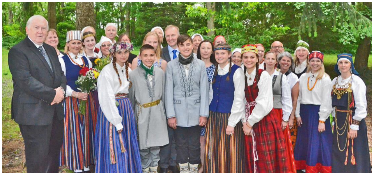
Nudžersijas skolas skolēni ar skolotāju saimi