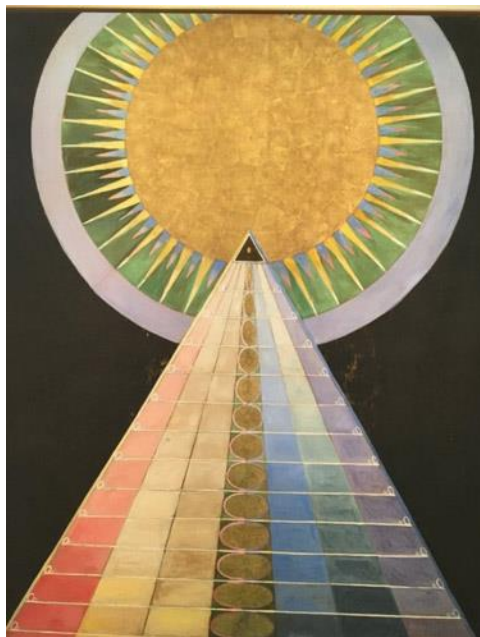
Altārgabals, Hilma af Klint, 20. g.s.

Atanāzijas ticības apliecības vidū paskaidro kā kri-