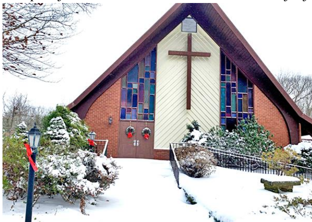
Salas baznīca sniegā