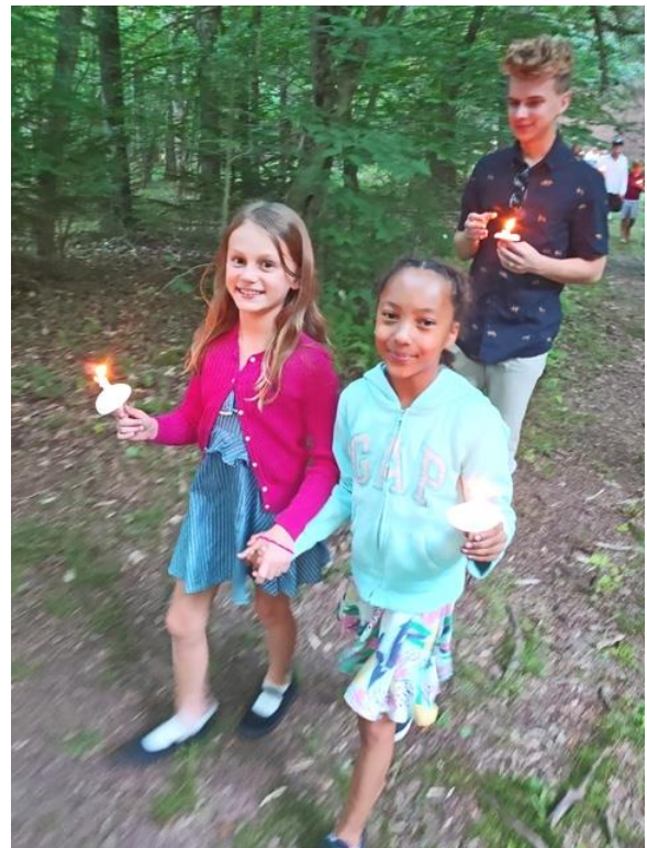
Ceļā uz svecīšu dievkalpojumu