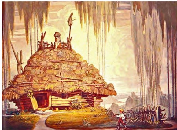
Sprīdītis atgriežas mājās, Ē. Dajevskis, 20. g.s.

Uz lapiņas redzam Sprīdīti atgriežamies mājās. Pēc piedzīvojumiem un nelaimēm Sprīdītis vairs nebaidas no tā, kas mājās ir grūts, un dziļāk novērtēt to, kas mājās ir labs. Līdzības mājas atgriešanās ainā tēvs, kas tik ilgi par dēlu sērojis, dēlu ieraugot no tālienes, skrien dēlam pretī, un viņu apkampj, nemaz negaidot atvairošanos.